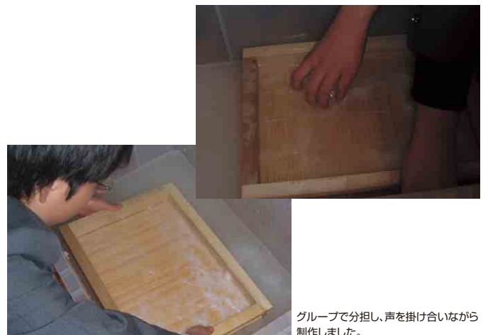
グループで分担し、声を掛け合いながら制作しました。