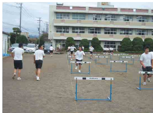
ハードルの練習をしている様子