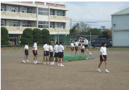
1年走り高跳びの授業の様子