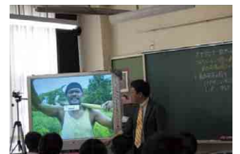
生徒にDVDを見せて解説