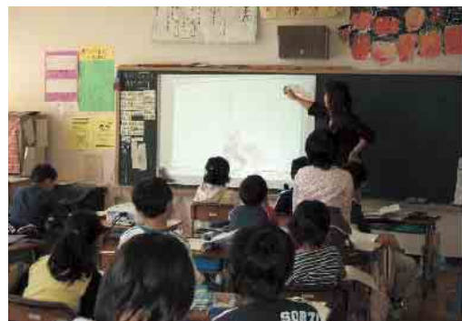
児童の発言を受けて、画面のページの同じ箇所にはラインを引く。発表者の考えを全員で確認することができる。

事前にスキャナーで取り込んでおいた作文用紙をプロジェクターで黒板に投影し、マスの使い方等の書き方を確認する。