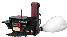
集じん装置付スピンドルベルトディスクサンダー