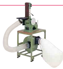
集じん機付ベルトディスクサンダー