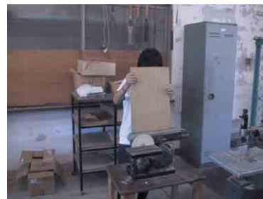
大きな部品の加工 (機械を使用しても平面を出すのは難しい)