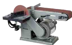
ベルトディスクサンダー