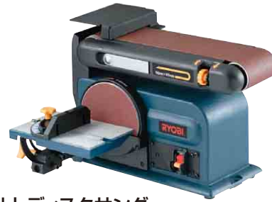
ベルトディスクサンダー