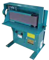
集じん口付ベルトサンダー